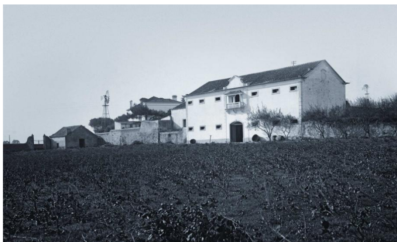
Fachada nascente da adega da Quinta do Barão, na primeira metade do século XX Colecção Isabel Burguete e Filhos Fotografia de Santos Almeida

A programação do Museu da Vinha e do Vinho de Carcavelos consubstancia, assim, o conceito de museu de sítio, através da evocação da memória do local e da valorização dos vestígios existentes, quer dos lagares, quer da adega com as suas arcadas no piso térreo, com o conceito de centro de interpretação, na apresentação multidisciplinar dos conteúdos referentes à história, ao território da Região Vitivinícola de Carcavelos, que abrange parte dos concelhos de Cascais e de Oeiras, ao ciclo da vinha e à produção, comercialização, divulgação e sociabilização deste vinho generoso.