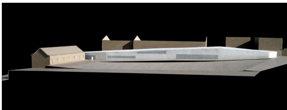
Maquetas do Museu da Vinha e do Vinho de Carcavelos Gabinete Barbini e Silva Arquitectos

Após a reabilitação, deixando o mais possível intacto o seu carácter simples e austero, a antiga adega irá acolher, no primeiro piso, a exposição permanente, estruturada em três núcleos – Carcavelos: memórias e personagens de um vinho generoso ; O Território ; Artes e Ofícios da Vinha e do Vinho -, e, no piso térreo, uma zona de adega e de prova de vinhos e a zona de exposições temporárias.