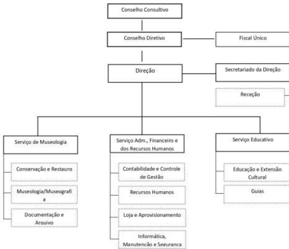
Fig. 1 – Organograma da FMD em 2024